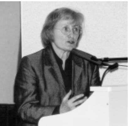
"Trop souvent, l'écologie et la justice sociale sont reléguées au second plan au nom de la libéralisation des marchés." (Madame la Ministre Aelvoet, dans son discours de clôture du symposium sur la politique de produits intégrée).

Vous trouverez quelques textes d'introduction au symposium sur le site web du Conseil.